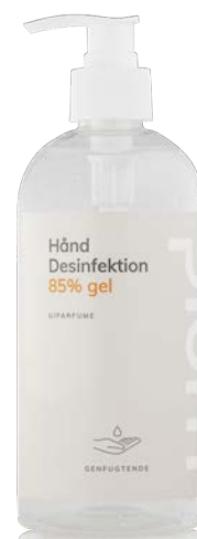
500 ml Hånddesinfektion Gel varenr: 3949

Biocider skal anvendes på forsvarlig vis. Læs altid mærkningen og produktoplysningerne før anvendelse.