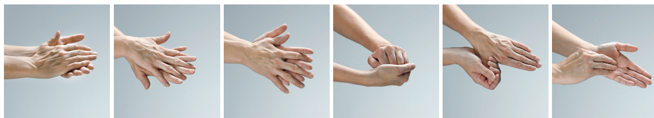
1: Håndflade mod håndflade.