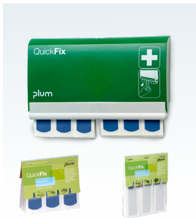
QuickFix refill med 45 stk. plastre

Vores plastre til levnedsmiddelsektoren er blå, iøjnefaldende og sporbare. Hvis jeres HACCP omfatter et kontrolpunkt med metaldetektor, bliver et tabt plaster let sporet og fundet, inden det ryger ud til kunderne.